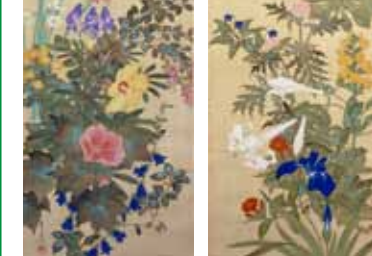
(左)TBM000347、(右)TBM000346 鈴木其一「四季草花図」江戸時代後期(19世紀中頃)、大英博物館蔵