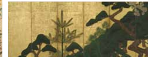
TFM000198 俵屋宗達(伝)「松樹図屏風」江戸時代前期、東京富士美術館蔵