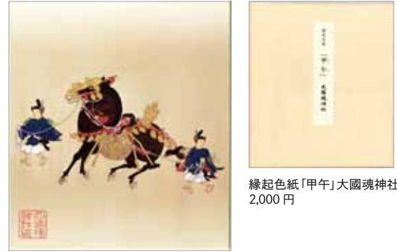
縁起色紙「甲午」大國魂神社 2,000円

大國魂神社は1900年もの歴史を持つ、東京都府中市にある神社です。武蔵国の守り神である大國魂大神が祀られ、厄除け祈願や縁結びの神社として知られています。大國魂神社では、縁起色紙を制作しておりますが、本年は干支である「甲午」と題し、馬の図案を全面に配しています。この色紙には、浮田一蕙筆 C0007000「飾馬図」（東京国立博物館所蔵）が採用されました。