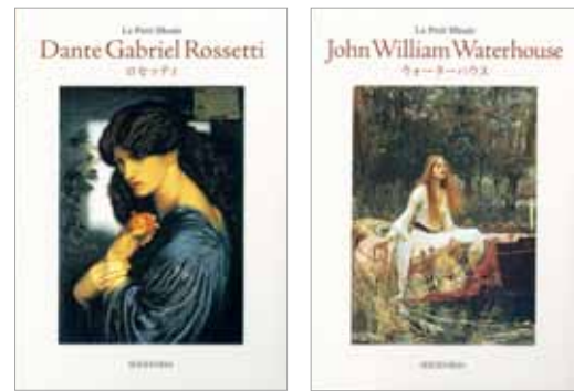
『ちいさな美術館 ロッセッティ』『同ウォーターハウス』青幻舎、各 1,260円(税込)

人気のポストカードブック・シリーズ『ちいさな美術館』に、現在開催中の大型展「ラファエル前派展」「ザ・ビューティフル展」に関連した2作家が加わりました。抒情的な女性画で知られるラファエル前派の中心人物ロッセッティ。神話や文学を題材に、妖艶な世界を表現するウォーターハウス。それぞれの代表作から厳選した各30作品を収録しています。当社では作品画像を提供致しました。