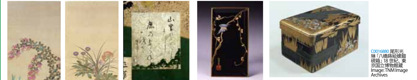
C0036824 俵屋宗達(伝)、本阿弥光悦/筆「色紙貼付松山吹図屏風、色紙部分」江戸時代 17世紀、東京国立博物館蔵