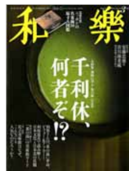
『和楽』小学館、1,300円(税込)

小学館『和楽』3月号は「茶の湯」特集号です。当社からは、東京国立博物館、静嘉堂文庫美術館、徳川美術館で所蔵されている茶碗の画像を多数提供いたしました。また、別冊付録「ニッポンの名茶碗 50 原寸大図鑑」では、歴史順に国宝、重要文化財といった日本を代表する茶碗を収録しています。