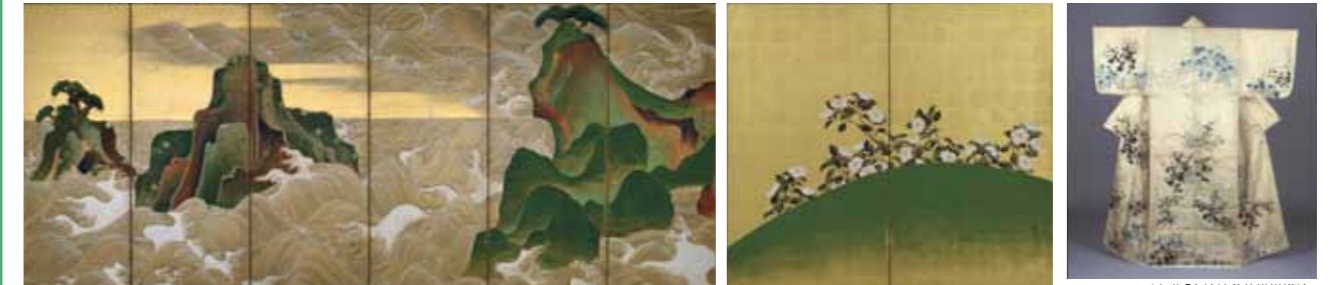
MFA000381 「松島図屏風」18世紀(江戸時代)、ボストン美術館蔵 Fenollosa-Weld Collection 11.4584

17世紀前半の桃山時代後期に、京都の町衆文化の中で活躍した本阿弥光悦と俵屋宗達が革新的な造形芸術を興しました。その後、宗達の作風を継承した尾形光琳とその弟で陶芸家の乾山によって、装飾性の高い絵画や書、工芸品などが作られました。さらに光琳に私淑した酒井抱一とその高弟・鈴木其一等に受け継がれました。琳派は、こうした断続的な関係で成立した流派という特色があります。その優れたデザイン感覚は、印象派や現代美術まで幅広く影響を与えています。今回は、イメージアーカイブに登録されている華麗なる琳派の作品をご紹介します。