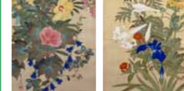
(左)TBM000347、(右)TBM000346 鈴木其一「四季草花図」江戸時代後期(19世紀中頃)、大英博物館蔵