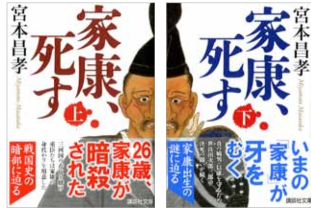
『家康、死す』(上・下) 講談社、各 693円(税込)

宮本昌孝氏による『家康、死す』（講談社文庫）は、戦国史の暗部に迫った時代小説です。徳川家康の暗殺と、その影武者の擁立から物語は始まり、次第に暗殺の陰謀が暴かれていきます。同書の表紙に「徳川家康三方ヶ原戦役画像」 TBM000050（徳川美術館所蔵）が採用されました。上下巻を並べることで家康の肖像が完成する、ユニークな表紙となっています。分裂した家康の肖像は、家康の影武者説を題材とした本書にふさわしいといえるでしょう。当社で提供した「徳川家康三方ヶ原戦役画像」は、敗戦後の憔悴しきった家康の表情が巧みに描かれています。