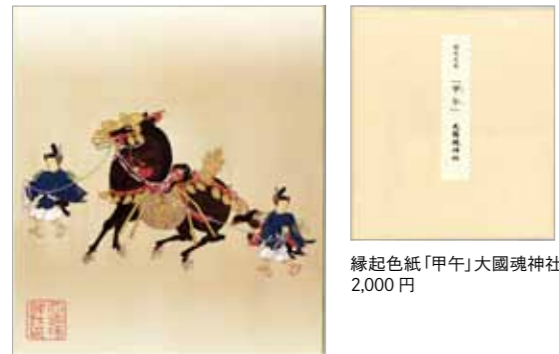
縁起色紙「甲午」大國魂神社 2,000円

大國魂神社は1900年もの歴史を持つ、東京都府中市にある神社です。武蔵国の守り神である大國魂大神が祀られ、厄除け祈願や縁結びの神社として知られています。大國魂神社では、縁起色紙を制作しておりますが、本年は干支である「甲午」と題し、馬の図案を全面に配しています。この色紙には、浮田一蕙筆 C0007000「飾馬図」（東京国立博物館所蔵）が採用されました。