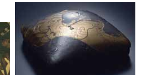
SAMD2006X006 尾形光琳「住之江時給硯箱 全体(閉)背景黒」江戸(18世紀)、静嘉堂文庫美術館蔵

◎タイトル盤の画像——TNM000764 酒井抱一「夏秋草図屏風(夏草図)」江戸時代 19世紀、東京国立博物館蔵