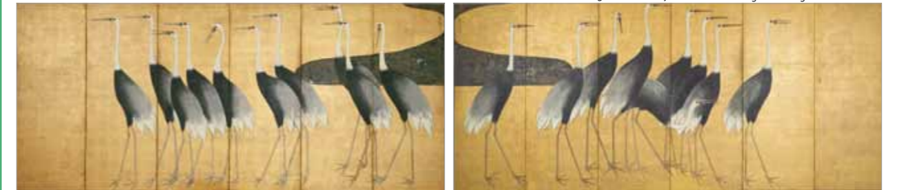
BAL491620, BAL492334 尾形光琳「群鶴図屏風」江戸時代、フリーア美術館蔵