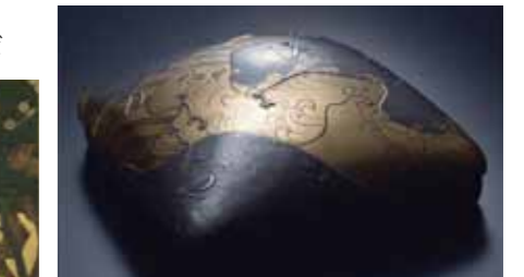
SAMD2006X006 尾形光琳「住之江時給硯箱 全体(閉)背景黒」江戸(18世紀)、静嘉堂文庫美術館蔵

◎タイトル盤の画像——TNM000764 酒井抱一「夏秋草図屏風(夏草図)」江戸時代 19世紀、東京国立博物館蔵 Image: TNM Image Archives