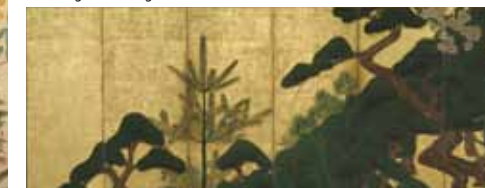
TFM000198 俵屋宗達(伝)「松林図屏風」江戸時代前期、東京富士美術館蔵