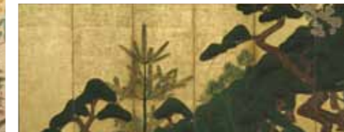
TFM000198 俵屋宗達(伝)「松林図屏風」江戸時代前期、東京富士美術館蔵