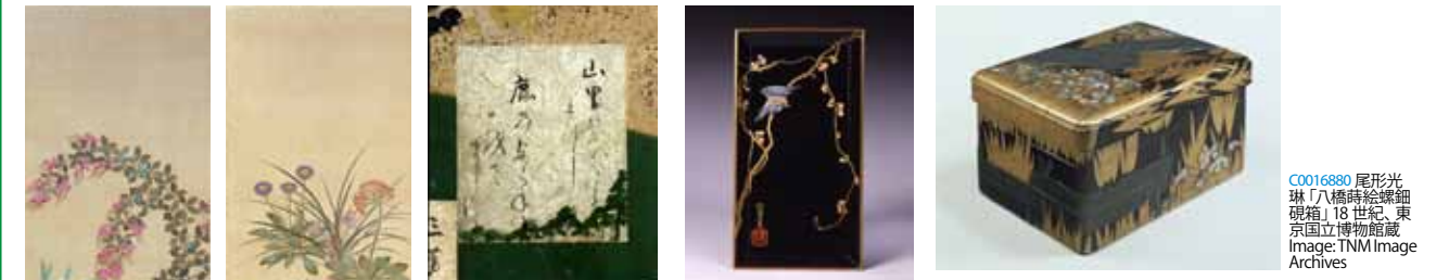
C0036824 俵屋宗達(伝)、本阿弥光悦/筆「色紙貼付松山吹図屏風、色紙部分」江戸時代 17世紀、東京国立博物館蔵