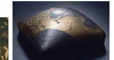
SAMD2006X006 尾形光琳「住之江時鐘硯箱 全体(閉)背景黒」江戸(18世紀)、静嘉堂文庫美術館蔵

◎タイトル盤の画像——TNM000764 酒井抱一「夏秋草図屏風(夏草図)」江戸時代 19世紀、東京国立博物館蔵