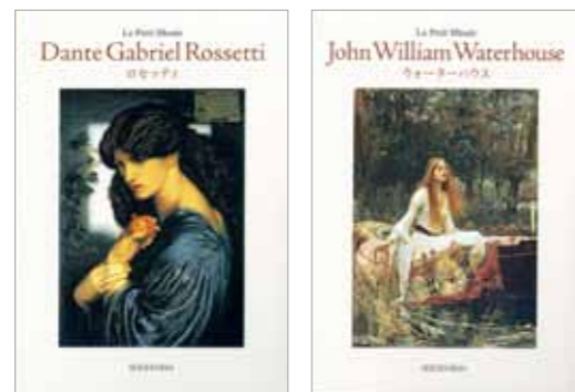
『ちいさな美術館 ロッセッティ』『同ウォーターハウス』青幻舎、各 1,260円(税込)

人気のポストカードブック・シリーズ『ちいさな美術館』に、現在開催中の大型展「ラファエル前派展」「ザ・ビューティフル展」に関連した2作家が加わりました。抒情的な女性画で知られるラファエル前派の中心人物ロッセッティ。神話や文学を題材に、妖艶な世界を表現するウォーターハウス。それぞれの代表作から厳選した各30作品を収録しています。当社では作品画像を提供致しました。