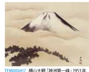
TFM000417 横山大観「神洲第一峰」1953年