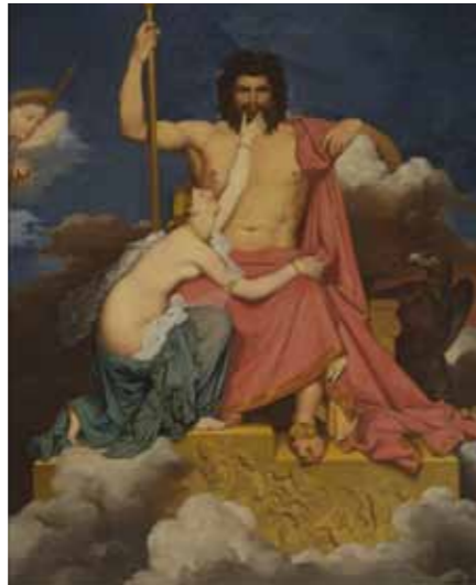
TFM000009 ジャン・オーギュスト・ドミニク・アングル「ユピテルとテティス」1807-25年頃 東京富士美術館