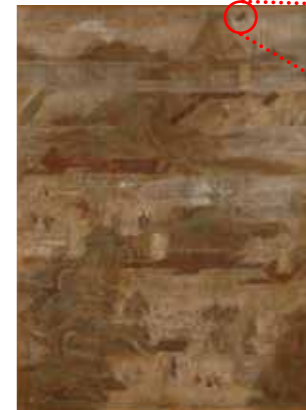
E0016441 秦致貞「聖徳太子絵伝 / 附修理銘」1069年