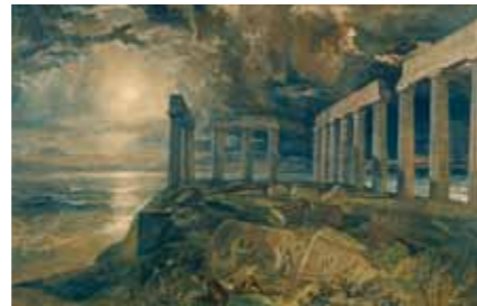
TATE107561 ジョゼフ・マロード・ウィリアム・ターナー「スニオンのポセイドン神殿（コロナナ岬）」1834年テート