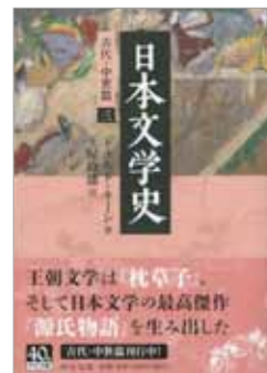
ドナルド・キーン、土屋政雄訳 『日本文学史 古代・中世篇三』 中央公論新社、1,100円(税込)

日本文学と日本文化研究の第一人者ドナルド・キーンが、日本文学への深い愛情をこめて執筆した魅力あふれる大著『日本文学史』。中世に生まれた日本文学の最高傑作『源氏物語』を中心に論述した「古代・中世篇(三)」の文庫表紙と口絵に、徳川美術館の国宝 TAM000248「源氏物語絵巻 竹河(二)絵」が選ばれました。