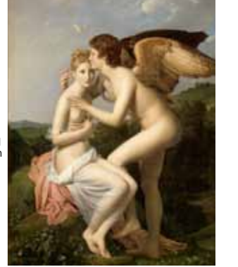
RM002121 フランソワ・ジュール「プシュケとクビド」ルーヴル美術館