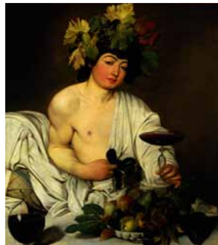
BAL000038 ミケランジェロ・メリージ・ダ・カラヴァッジオ「バックス」ウフィツィ美術館