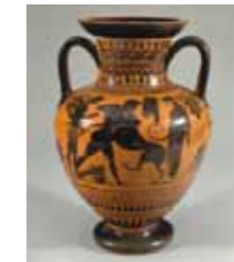
ART102022 「ネメアのライオンを殺めるヘラクレスとアイオロスおよびアテナ」ニューアーク美術館 Newark Museum / Art Resource, NY / DNPpartcom