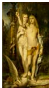
RMN9300031002 ギュスターヴ・モロー「イアソン」1865年オルセー美術館