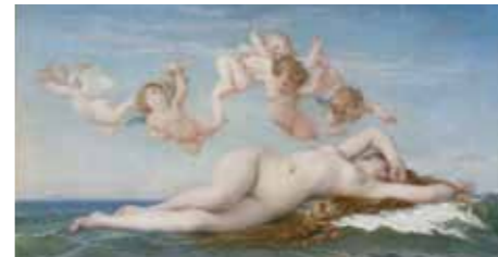
RMN01015735 アレクサンドル・カバネル「ヴィーナスの誕生」1863年オルセー美術館