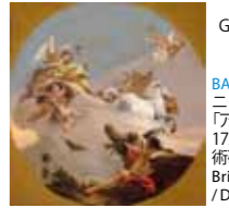
BAL339870 ジョヴァンニ・ドメニコ・ティエポロ「アウロラの凱旋車」1730年クラーク美術館研究所