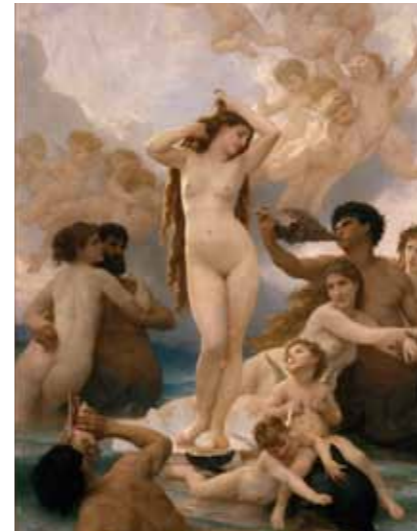
RMN94050008 ウィリアム・アドルフ・ブグロ「ヴィーナスの誕生」1879年オルセー美術館