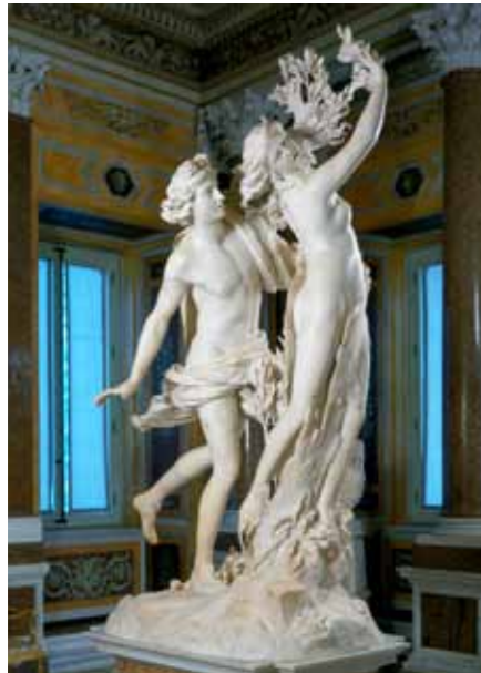
ALI000038 「アポロとダフネ」ボルゲーゼ美術館