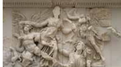
BPK00003964 「ヘルガモンの大祭壇（復元）部分アテナ（オリジナル）」前164～前156年頃（復元）1930年ベルリン国立美術館古代ギャラリー