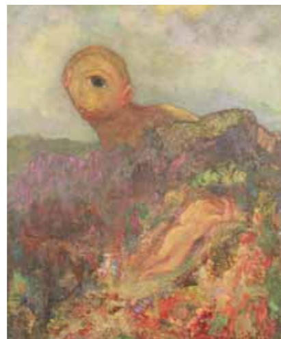
BAL000021 オデオン・ルドン「キュクロプス」1914年クラーク美術館