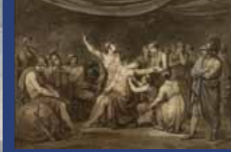
YAG000130 「ヘクトルに殺害されたトロイアの王子パリスを宣旨するアキレス」1808年エール大学美術館