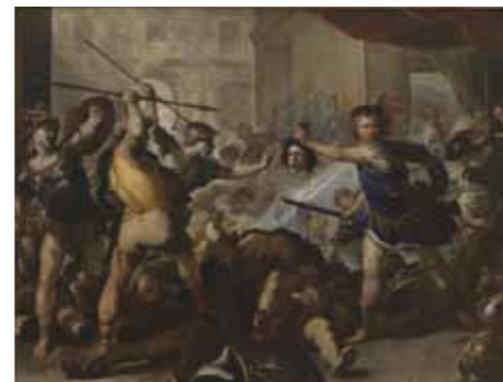
NGL002276 ルカ・ジョルダ「フィネウスとその一味を石に変えるペルセウス」1680初期年 ロンドン・ナショナル・ギャラリー