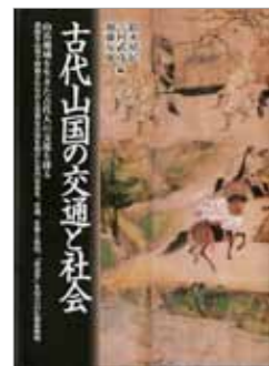
編者：鈴木靖民 / 吉村武彦 / 加藤友康 『古代山国の交通と社会』 八木書店 8,400円(税込)

八木書店から発行された書籍『古代山国の交通と社会』に、東京国立博物館所蔵、重文 C011189「因幡堂薬師縁起」が表紙に採用されました。本書は、古代山岳地域の多様な交通のあり方とその交通が展開した地域社会の歴史的位相を論じた専門書です。鎌倉時代に描かれた表紙の絵から、山国を舞台としたその当時の人々の交流を伺うことができます。