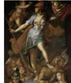
KHM1133 バルトロメウス・ファン・デル・ストロプ「アテナ」1593年頃ウィーン美術史美術館