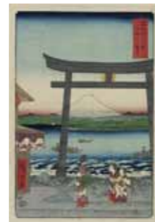
MFA1126324 歌川広重「富士三十六景 相模江の鳥入口」江戸時代 ポストン美術館 William Sturgis Bigelow Collection, 1911, 11.26324

日本最高峰の富士山は、太古の頃から、その山姿の美しさと偉容により、御神体として崇められてきました。連綿と続いてきた富士山信仰。平安時代から現代に至るまでの美術作品の中に、富士山は繰り返し登場します。イメージアーカイブでは、富士山をモチーフにした数多くの美術作品画像をご用意しております。