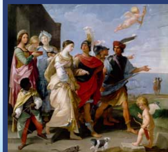
RMN05535041 グイド・レーニ「ヘレネの誘拐」ルーヴル美術館