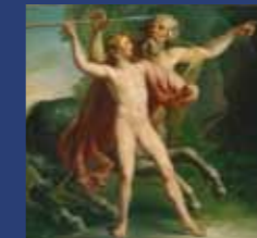
ART194158 ジョヴァンニ・バッティスタ・スタチア「アキレスの教育」1776年頃 フィラデルフィア美術館

「トロイの木馬」で有名なホメロスの叙事詩『イリアス』は、「アキレス腱」の由来になったギリシャの英雄アキレスの物語です。トロイアの王子パリスが世界一の美女ヘレネを敵国ギリシャから奪った事が発端でトロイア戦争は起こりました。この戦争で、アキレスがトロイアの英雄ヘクトル（パリスの兄）を討ち取りました。後に、ギリシャとトロイア両陣の主要人物達の壮絶な生き様が後世の画家達によって数多く描かれました。