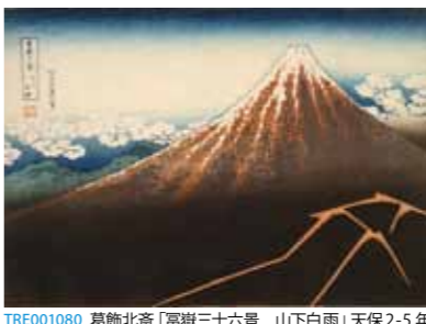
TRE001080 葛飾北斎「富嶽三十六景 山下白雨」天保2-5年(1831-1835)頃