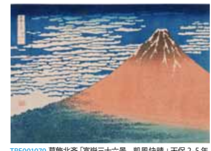
TRE001079 葛飾北斎「富嶽三十六景 颯風快晴」天保2-5年(1831-1835)頃