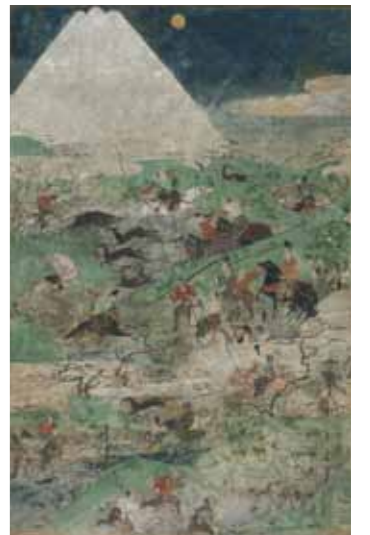
C0022473 作者不詳「月次風俗図屏風」16世紀 東京国立博物館 Image:TNM Image Archives

<部分拡大図> 「聖徳太子絵伝」の富士は、現存する日本最古の絵で、太子が甲斐の黒駒に乗って富士を越えていく様子が描かれている。富士を飛び越える姿は太子の超人性を表現している。