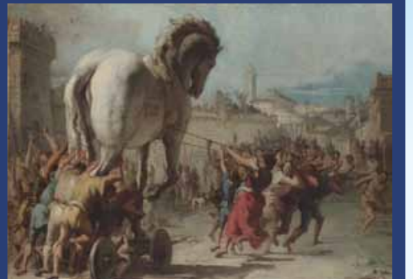
NGL001537 ジョヴァンニ・ドメニコ・ティエポロ「トロイの木馬の侵入」ロンドン・ナショナル・ギャラリー