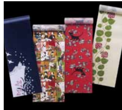
株式会社やまと 夢二柄長襦袢(絹100%)

竹久夢二美術館所蔵8作品が、長襦袢反物と小千谷小紋反物に変身しました。きものやまとが、2013年5月16日から全国約70箇所の特設会場にて開催する『プレミアムセール やまと美裳会「きもの美術館～継承の美・未来の美」』で販売されました。写真は長襦袢。左から、TYM000319「汝が碧き眼を開け」、TYM000206「家族双六」、TYM000239「都会の巻」、TYM00205「手製半襟の図版」。小千谷小紋には、傘の絵柄が可愛い TYM000282「『若草』5月号表紙」など、TYM000204「少年山荘 手拭い」、TYM000247「蛍草」、TYM000131「愛の総勘定」の画像を提供しました。