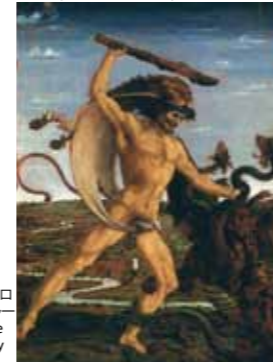
ALI000019 アントニオ・デル・ポッライオーロ「ヘラクレスとヒュドラ」ウフィツィ美術館