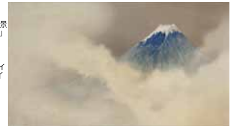
C0037415 清川惣助「七宝富嶽図額」19世紀