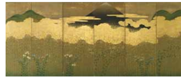
TFM000190 作者不詳「武蔵野図屏風」江戸時代前期