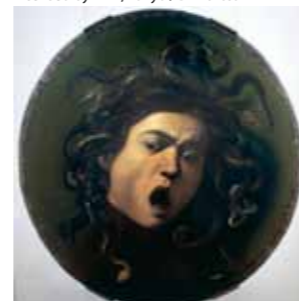
ALI000059 ミケランジェロ・メリージ・ダ・カラヴァッジオ「メデューサ」ウフィツィ美術館