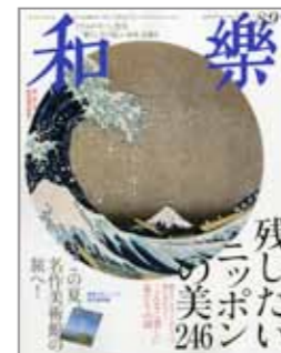
TRE001078 葛飾北斎「富嶽三十六景 神奈川沖浪裏」天保2-5年(1831-1835)頃

小学館の雑誌『和楽』に、東京都江戸東京博物館所蔵の葛飾北斎作 TRE001078「富嶽三十六景 神奈川沖浪裏」の画像が掲載されました。世界文化遺産登録を機に、いま富士山の美術作品の利用が増えています。有名な「赤富士」TRE001079「颯風快晴」や TRE001080「山下白雨」等、色彩豊かな北斎の浮世絵も大人気です。